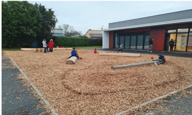
Exemple d'installation réalisée à Betton.